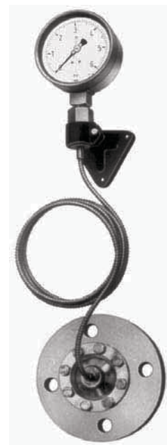
带毛细管的化学密封

正常安装情况下仪表需配额外的安装支架。注意任意仪表于化学密封间的水平差都会产生一个静压作用在仪表上。如果知道该水平差，可以在组装校验时把静压考虑进去。见化学密封咨询表，在现场可以通过调节仪表指针校对正极小的偏差，同时做温度补偿。