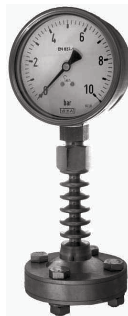
配置冷却塔的化学密封